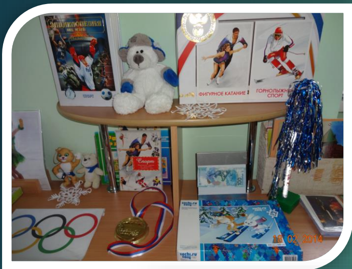
Социальные миницентры в группах