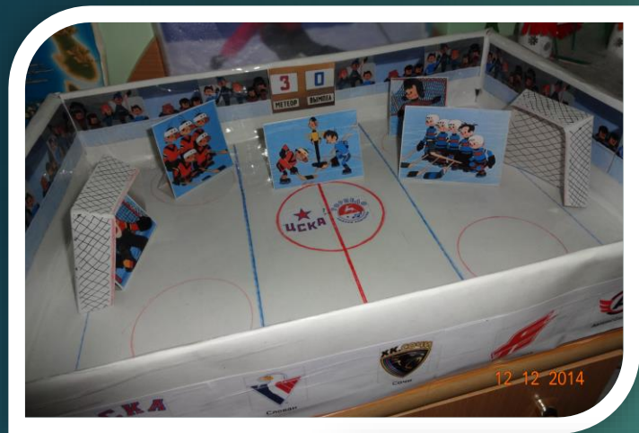
Макеты спортивных объектов